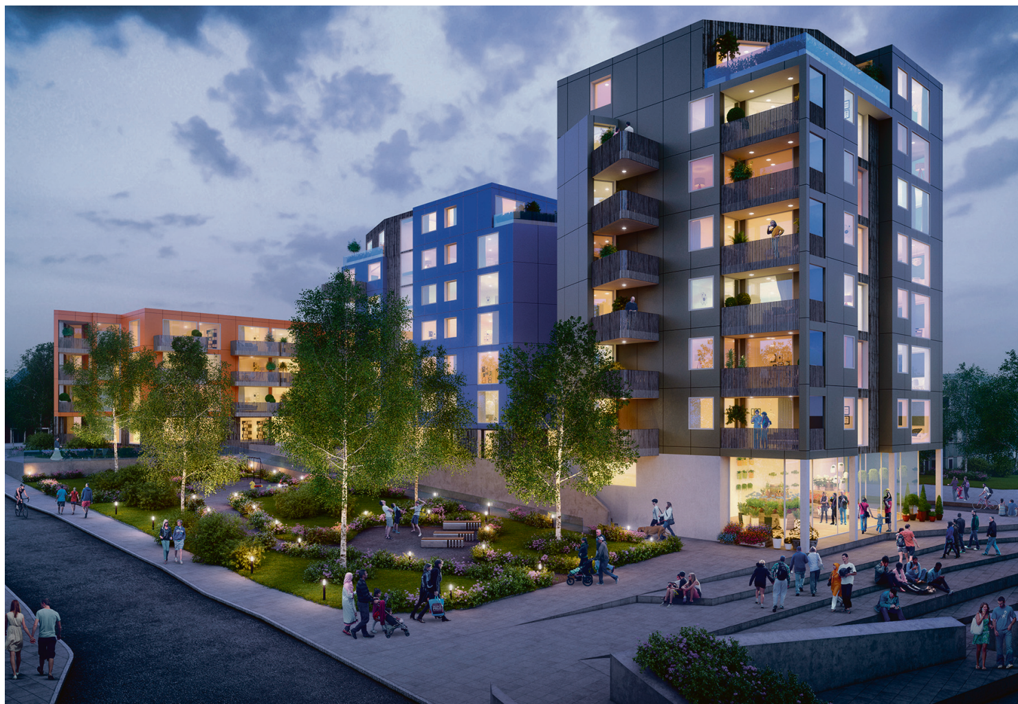
MELLOM PRIMA OG ADRESSA Her kommer "Heimdal Stasjonsby" med 85 nye, sentrumsnære boliger med fra 1- til 4-roms leiligheter med balkong. Nærmest jernbanen blir byggehøyden 8 etasjer, med en nedtrapping mot Industriveien ned til 4 etasjer.

–Vi anlegger også fine grøntområder med benker og lekeapparater som gir rom for lek og avslapping, sier prosjektsjef Selvaag. –Et sted å bli bedre kjent